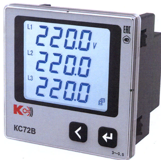
Рисунок 7 – Общий вид приборов KC72B (трехфазная модификация)