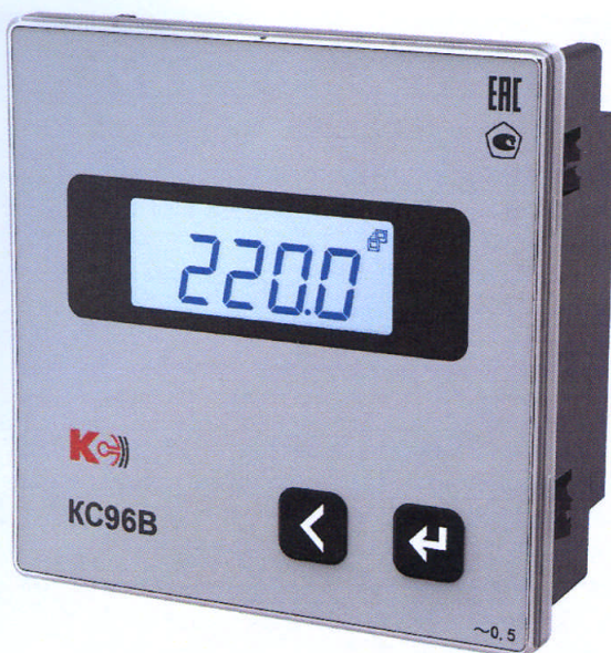
Рисунок 8 – Общий вид приборов KC96B (однофазная модификация)