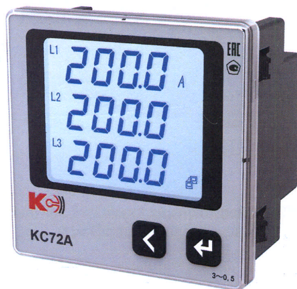
Рисунок 3 – Общий вид приборов КС72А (трехфазная модификация)