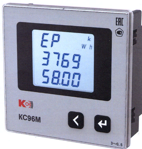
Рисунок 11 – Общий вид приборов KC96M