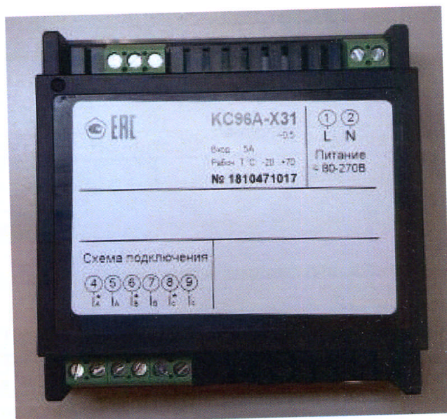
Рисунки 13 – Общий вид приборов KC96A (трехфазная модификация). Вид сзади