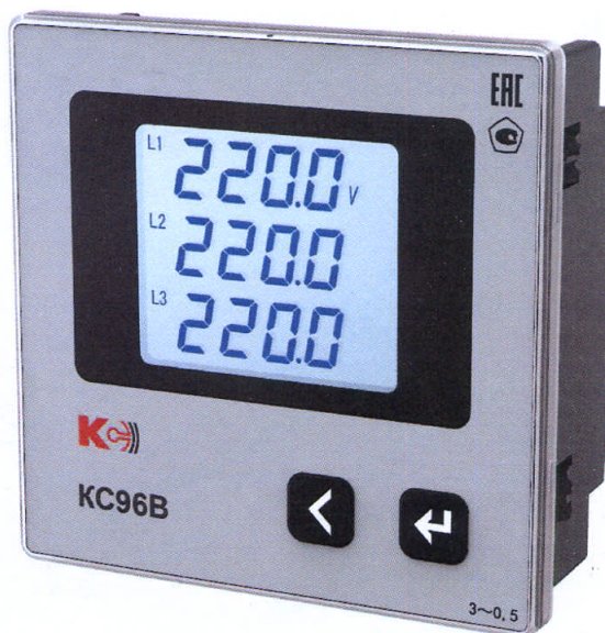
Рисунок 9 – Общий вид приборов KC96B (трехфазная модификация)