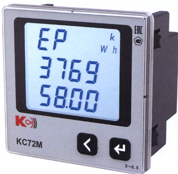
Рисунок 10 – Общий вид приборов KC72M