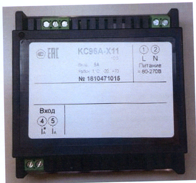
Рисунки 12 – Общий вид приборов KC96A (однофазная модификация). Вид сзади