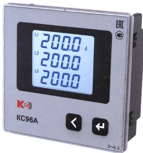
Рисунок 5 – Общий вид приборов KC96A (трехфазная модификация)