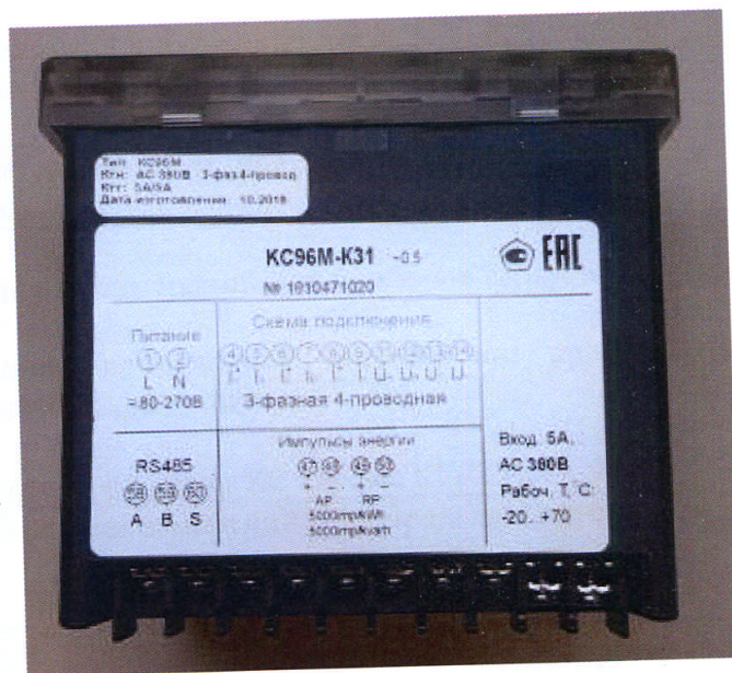
Рисунки 15 – Общий вид приборов KC96M. Вид сзади