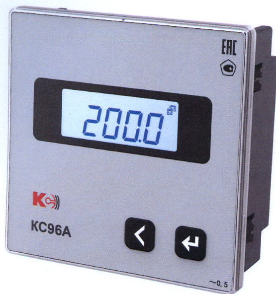
Рисунок 4 – Общий вид приборов KC96A (однофазная модификация)