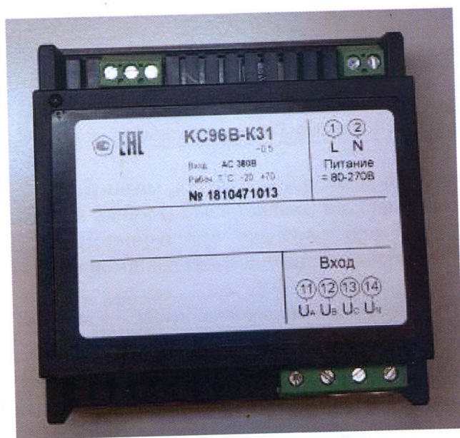
Рисунки 14 – Общий вид приборов KC96B (трехфазная модификация). Вид сзади