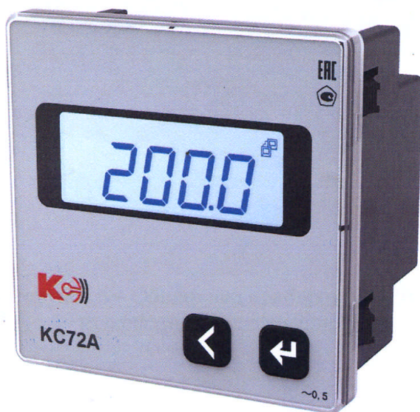
Рисунок 2 – Общий вид приборов КС72А (однофазная модификация)