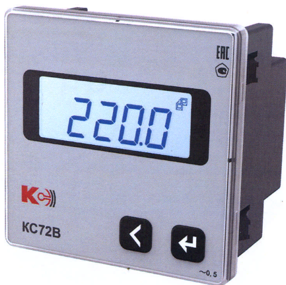
Рисунок 6 – Общий вид приборов KC72B (однофазная модификация)